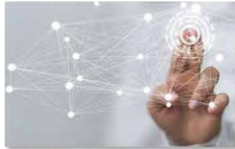
Digitalisierung & Vernetzung