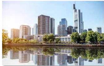
Zurück in die Stadt